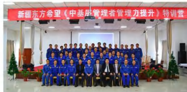
2024年民营企业百强排名42 东方希望集团成交训练营25期 (培养管理干部1293人)