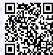
绿色网点建设和节能减排