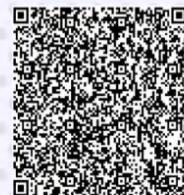
养老金融网点建设和运营