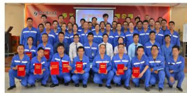
2024年民营企业百强排名89 杭州锦江集团成交训练营31期 (培养管理干部1592人)

课程合作热线：13983636348龚老师 官方网站：www.alpha-360.com