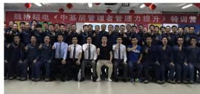
2024年民营企业百强排名第9 魏桥创业集团成交训练营69期 (培养管理干部3465人)