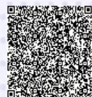
网点布局规划和选址